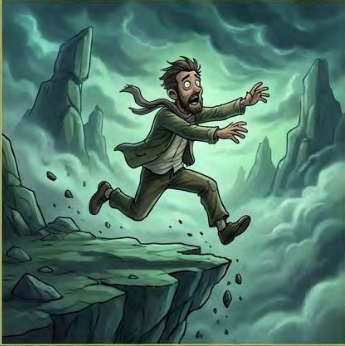
Bilgisizlikten gelen korkusuzluk ' cehalet '