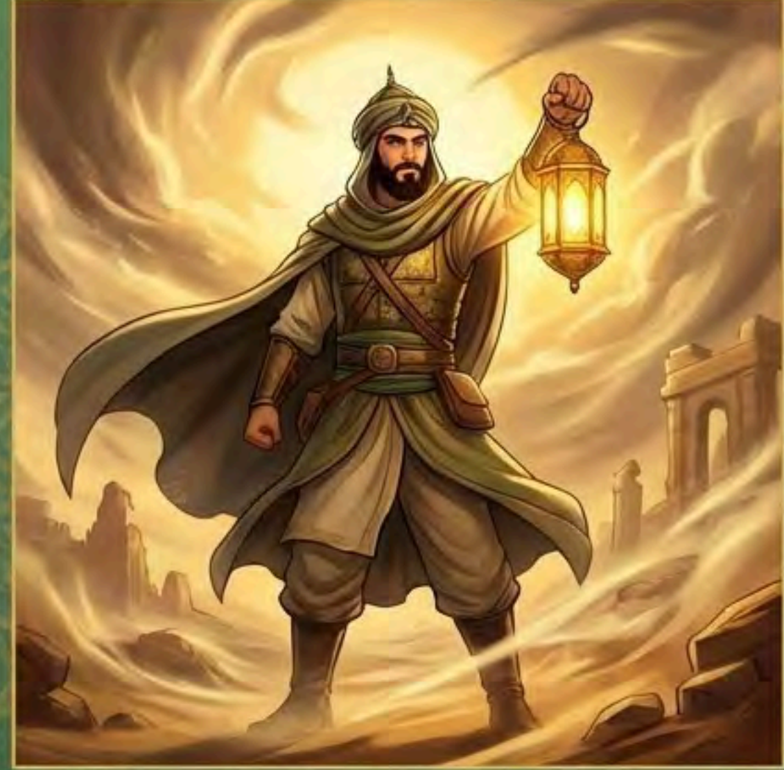
Akıldan ve imandan gelen korkusuzluk ise gerçek ' cesaret 'tir.

Cesaret ; korkusuzluk ve yüreklilik demektir. Ancak her korkusuzluk cesaret değildir.