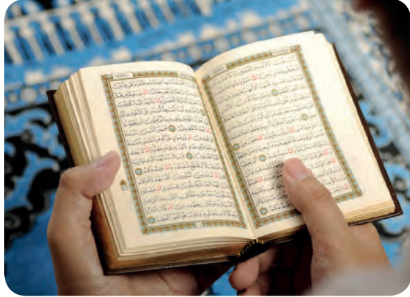
Kur'an-ı Kerim, Müslümanların kılavuzudur.